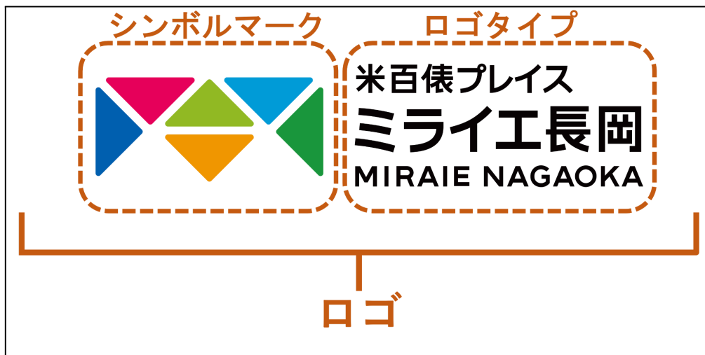
図1 シンボルマークとロゴタイプの定義