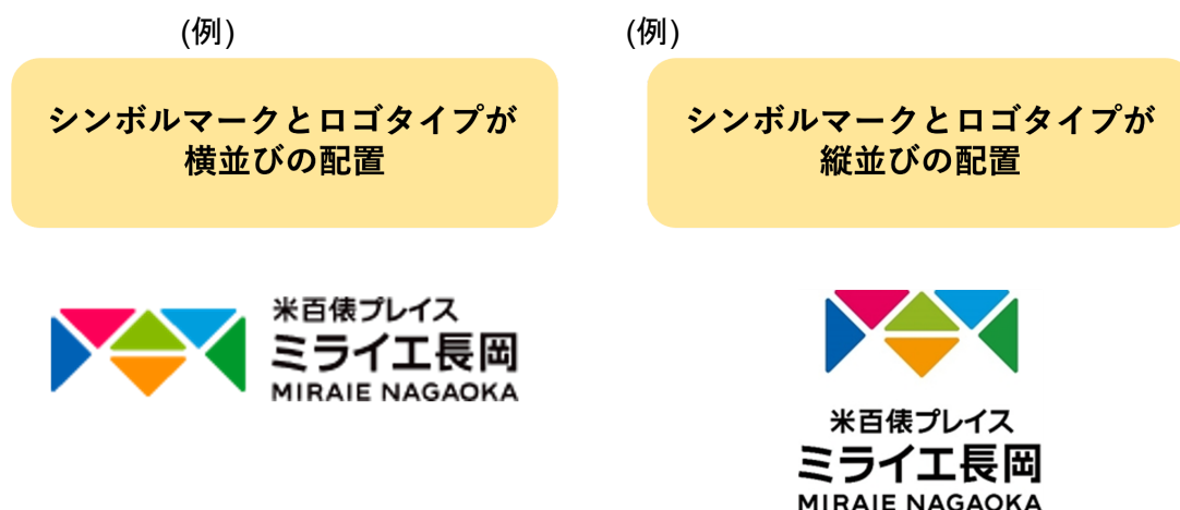
図3 シンボルマークとロゴタイプの並びの変更例